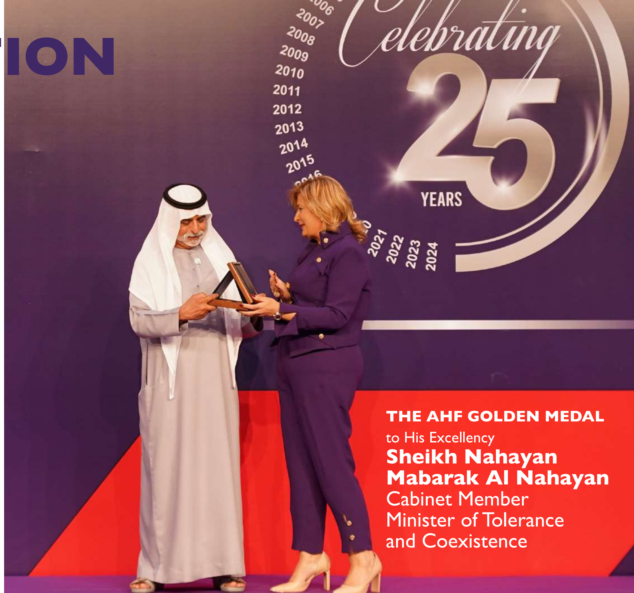
THE AHF GOLDEN MEDAL to His Excellency Sheikh Nahayan Mabarak Al Nahayan Cabinet Member Minister of Tolerance and Coexistence