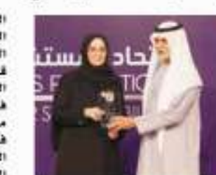
التكريم من حضرة صاحب الجلالة الملك حمد بن عيسى آل خليفة ملك البحرين

حازت الدكتورة جليلة بنت السيد جواد، وزيرة الصحة، بجائزة المرأة المتميزة في القطاع الصحي العربي، تقديراً لإسهاماتها في تطوير القطاع الصحي في مملكة البحرين، وتعزيز جودة الرعاية الصحية المقدمة في المملكة، وذلك خلال حفل الاحتفاء بمرور 25 سنة على تأسيس اتحاد المستشفيات العربية، وتكريم القياديين الرواد في قطاع الصحة، الذي أقيم خلال الفترة 29-30 أكتوبر، وهي أبوظبي بدولة الإمارات.