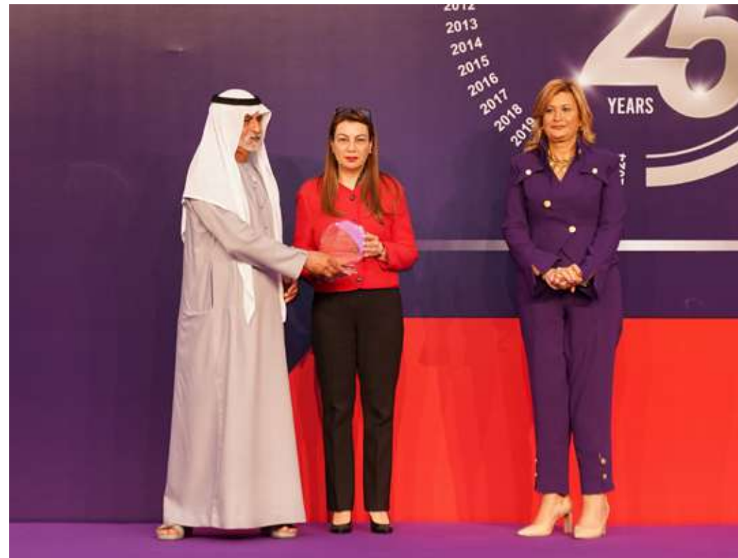
JOHNSON & JOHNSON