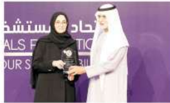
نهيان بن مبارك يكرم مشاركة في الملتقى

افتتح الشيخ نهيان بن مبارك آل نهيان وزير التسامح والتعايش، الملتقى الـ 25 لاتحاد المستشفيات العربية الذي يقام في فندق كونراد أبوظبي بأبراج الاتحاد يومي 29 و30 أكتوبر الجاري ويتزامن هذا العام مع احتفاله باليوبيل الذهبي لعميرته.