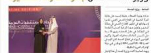
عندما تم منح الجوائز لثلاث مستشفيات حكومية في أبوظبي، وهي مستشفى راشد، ومستشفى خليفة، ومستشفى زايد العسكري، وذلك من قبل وزير الصحة، نهيان بن مبارك، وذلك خلال حفل الافتتاح بمرور 25 سنة على تأسيس اتحاد المستشفيات العربية، والذي أقيم خلال الفترة 29-30 أكتوبر.