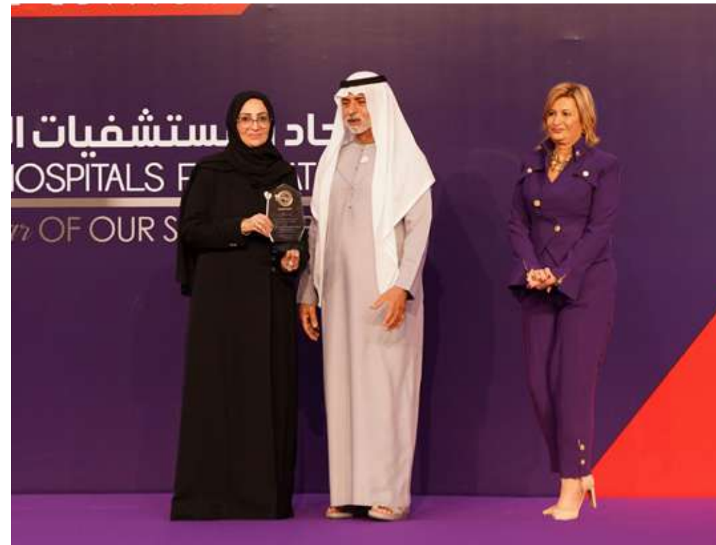
HER EXCELLENCY DR. JALEELA BINT SAYED JAWAD HASSAN