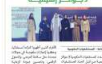
عندما تم منح الجوائز لثلاث مستشفيات حكومية في أبوظبي، وهي مستشفى راشد، ومستشفى خليفة، ومستشفى زايد العسكري، وذلك من قبل وزير الصحة، نهيان بن مبارك، وذلك خلال حفل الافتتاح بمرور 25 سنة على تأسيس اتحاد المستشفيات العربية، والذي أقيم خلال الفترة 29-30 أكتوبر.