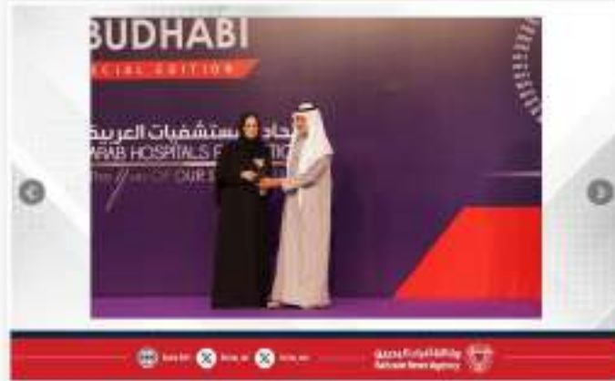
أحمد بن محمد بن راشد آل مكتوم