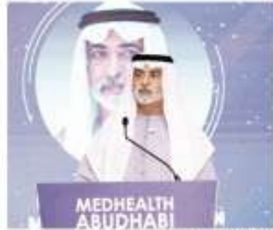
نهيان بن مبارك يلقي كلمته